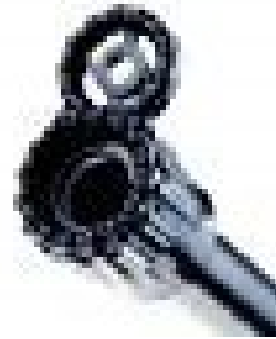
Zielvorrichtungen jeglicher Art